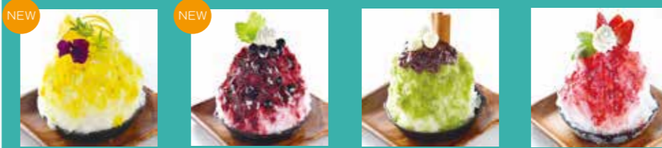
期間限定 河内ばんかんとはちみつ / ブルーベリーヨーグルト / 豊橋抹茶きな粉ぜんざい / とろ～りいちごみるく

hana・yasaiのかき氷は「かまくら」をイメージ。ふわふわの氷のなかには豊橋のんほいソフトクリームが隠れていて、二度楽しめる美味しさです♪