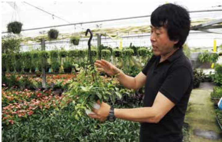
△1年の中で育てている観葉植物の種類は200～300種類もあるそうです。