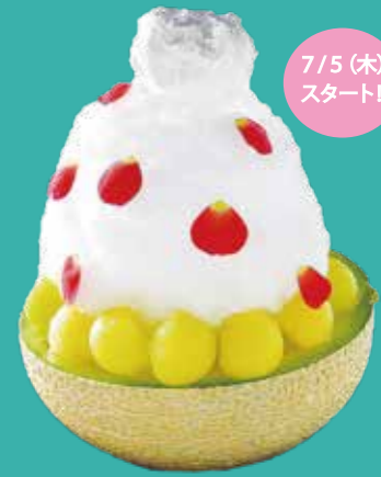
7/5(木)スタート! 数量限定 とろ～り渥美半島完熟メロンクリーム

初登場!河内ばんかんとはちみつは、はちみつレモンの甘酸っぱいお味です。中の豊橋のんほいソフトクリームと食べることでより一層味の変化を楽しんでいただける逸品です。 渥美半島のメロンを使用したとろ～り渥美半島完熟メロンクリームは数量限定で7月5日(木)からスタート! 他にも今年は定番のいちごや抹茶の他にブルーベリーヨーグルトも登場しました。今年の暑い夏は、はなやさいのかき氷でひんやり涼んでみてくださいね。